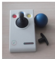
Джостик (мышка) для детей с нарушением ОДА