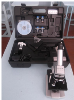
Цифровой микроскоп с увеличением в 1800 раз