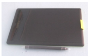
графический планшет «ВамВoo»