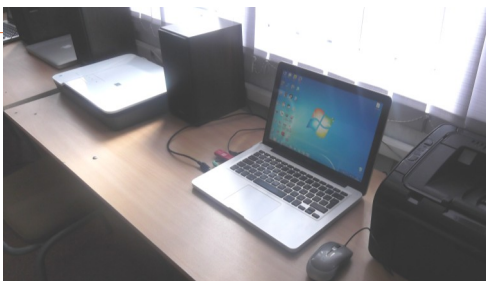
Рабочее место учителя