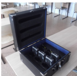
Зарядное устройство для слабослышащих детей. Передатчик и приёмник системы «Диалог».